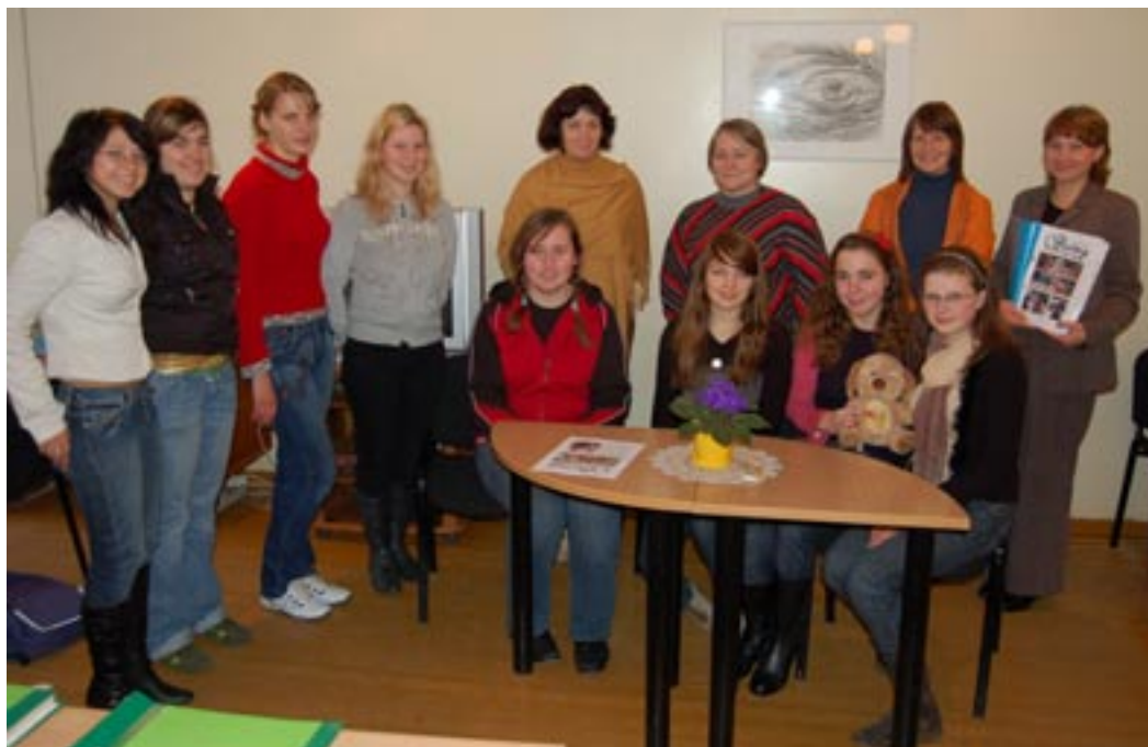
19 - o „Šulinio“ numerio pristatymo metu.