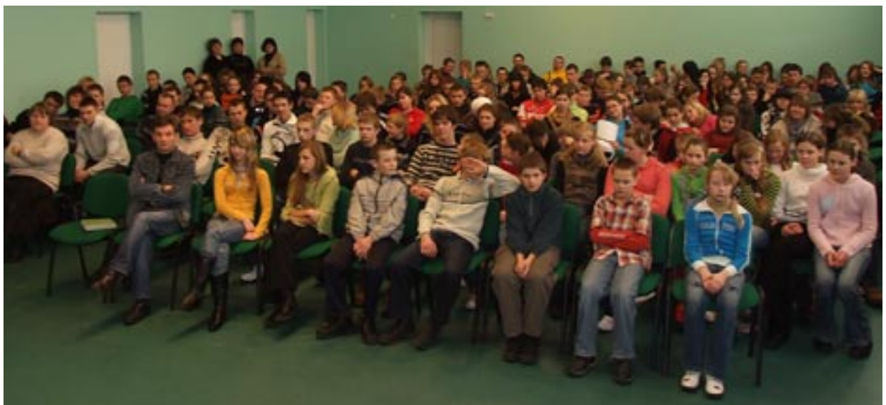
paminėti Sausio 13 susirinkę mokiniai išvydo dvyliktokų kompoziciją (vad. R. Černiauskiene)