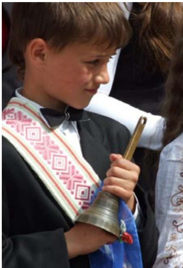
Paskutinio skambučio akimirkos Aisčio Jurkonio nuotraukose