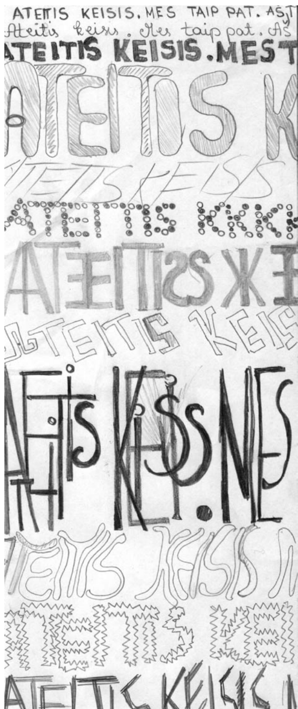
Emos Juškevičiūtės piešinys, II g kl., 2010