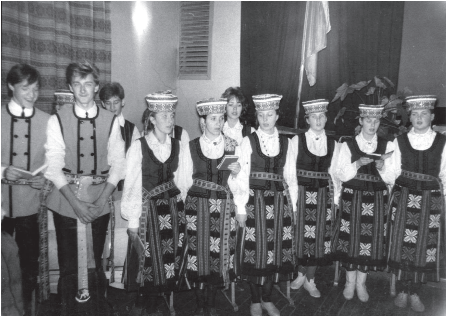
Pirmą kartą Sajūdžio pažadinti merkiniškiai oficialiai švenčia Krėvės gimtadienį. 1988 metų rašytojo 106-ujų gimimo metinių minėjime į Merkinės kultūros namų salę įnešta trispalvė