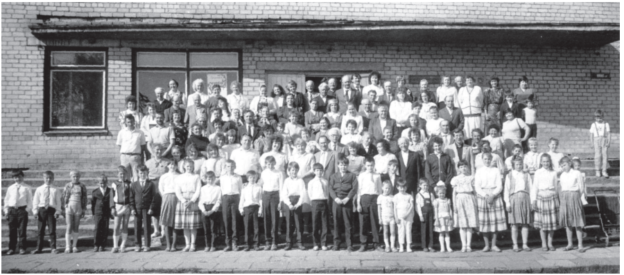
Merkiniškiečiai po koncerto, kuriame buvo renkamos aukos V. Krėvės paminklo pastatymui Merkinėje 1992 m.

Lietuvos kultūros fondas Šventųjų Jonų bažnyčioje surengė labdarinę koncertą, kuriame grojo Lietuvos simfoninis orkestras, diriguojamas Gintaro Rinkevičiaus, ir dainavo choras „Ažuoliukas“. Renkamos lėšos Dzūkų kultūros draugės susirinkime Alytuje, labdaringame koncerte Merkinėje. Varėniškiai surengė koncertą Varėnos kultūros namuose, kuriuose grojo viso rajono kaimo kapelos, dainavo dainininkai, sukosi poros.